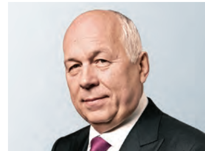
Чемезов Сергей Викторович

Доли в уставном капитале ПАО «Аэрофлот» не имеет.